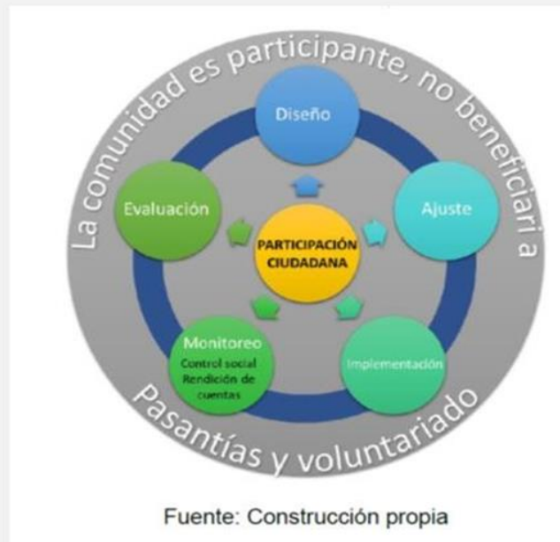
Gráfica: Participación Ciudadana

La Unidad desde el diseño del Planfes vinculó a los diferentes actores y grupos de interés a través de foros, encuestas, mesas de trabajo, actividades de socialización, informes folletos y se diseñó un micro sitio en la página web para informar cada uno de los avances de la construcción del Planfes, que se encuentra en el siguiente link: http://sitios.orgsolidarias.gov.co/PAZ/