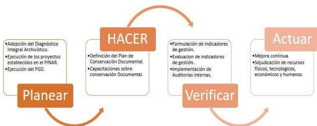
Ilustración 1. Ciclo de implementación del SIC.

Para la ejecución del Sistema de Conservación Documental se utilizará la herramienta de mejora continua del ciclo PHVA que se basa en un (1) ciclo de cuatro (4) pasos como lo es: Planificar (Plan), Hacer (Do), Verificar (Check) y Actuar (Act). A continuación, se presentan los requerimientos para el cumplimiento efectivo de las acciones determinadas: