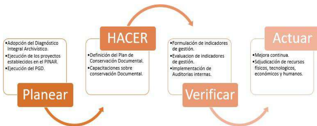
Ilustración 1. Ciclo de implementación del SIC.

Para la ejecución del Sistema de Conservación Documental se utilizará la herramienta de mejora continua del ciclo PHVA que se basa en un (1) ciclo de cuatro (4) pasos como lo es: Planificar (Plan), Hacer (Do), Verificar (Check) y Actuar (Act). A continuación, se presentan los requerimientos para el cumplimiento efectivo de las acciones determinadas: